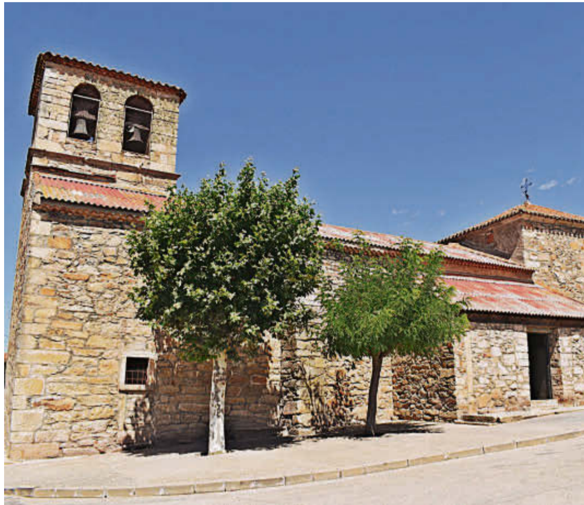
Una de las obras incluida en el convenio es la reparación de la cubierta de la iglesia de Martinamor. EÑE